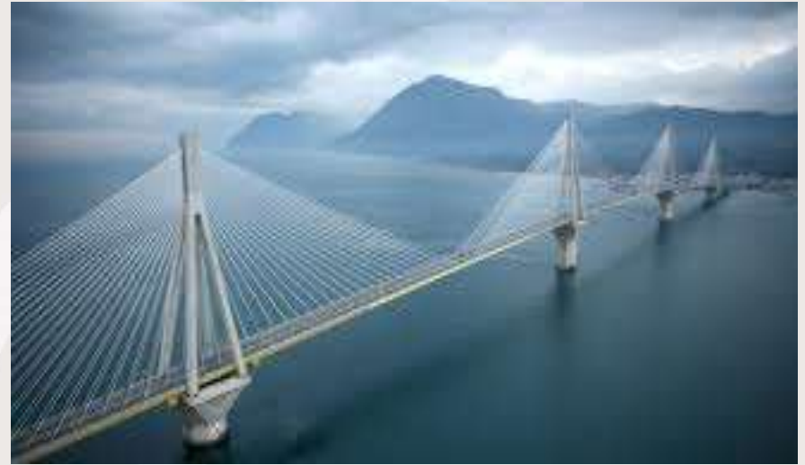
Γέφυρα Ρίου - Αντίρριου